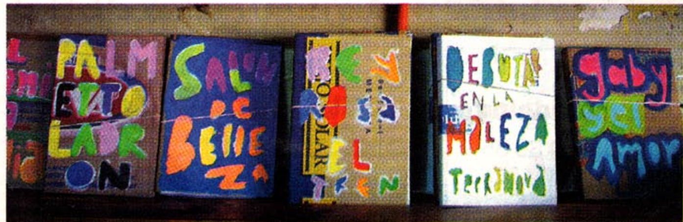
Gör konst av skräp. Omslagen till böckerna är handmålade i oblandade grundfärger.